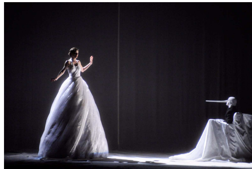
Joël Pommerat, Pinocchio

UNIVERSITÉ D'ARTOIS 9, rue du Temple 62030 Arras tél. 03 21 60 37 00 www.univ-artois.fr