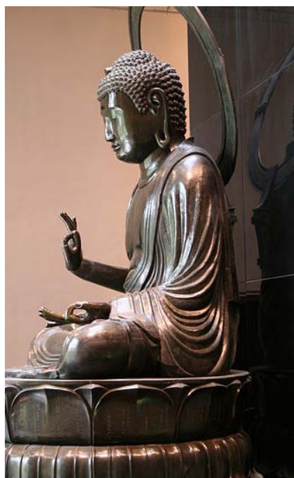
Le Bouddha Amida, Musée Cernuschi

14 mai 2014 Salle des colloques, Maison de la Recherche (I)