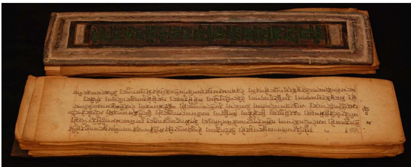
Livre de prières tibétain

(1 ère partie du 2 ème colloque consacré à la traduction du sacré)