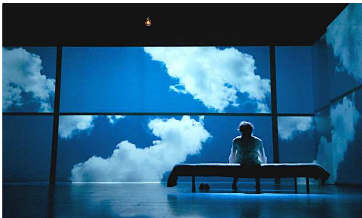
Joël Pommerat, Cendrillon

Maison de la Recherche - Salle des colloques (Bâtiment I) - Arras