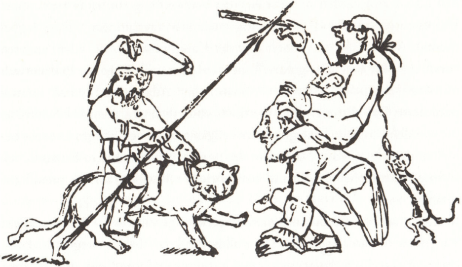
Hoffmann et le chat Murr en lutte contre la bureaucratie prussienne, dessin d'E. T. A. Hoffmann, 1820/21